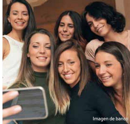
Imagen de banco

Merck Sharp & Dohme de España, S.A. C/ Josefa Valcárcel, 38 · 28027 Madrid. Copyright © 2024 Merck & Co., Inc., Rahway, NJ, USA and its affiliates. Todos los derechos reservados. ES-NON-03476 (Creado: junio 2024)